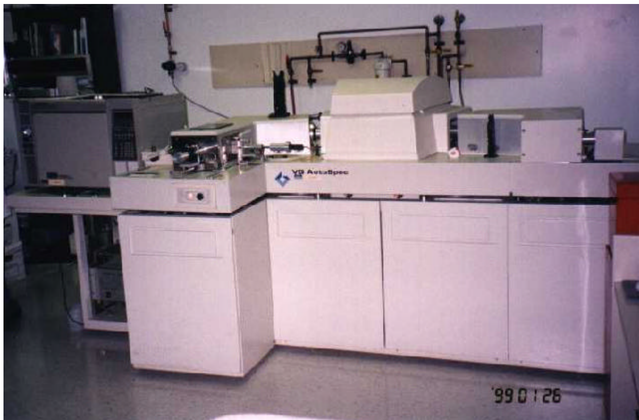
図 2 . (5) - 2 . ガスクロマトグラフ質量分析器