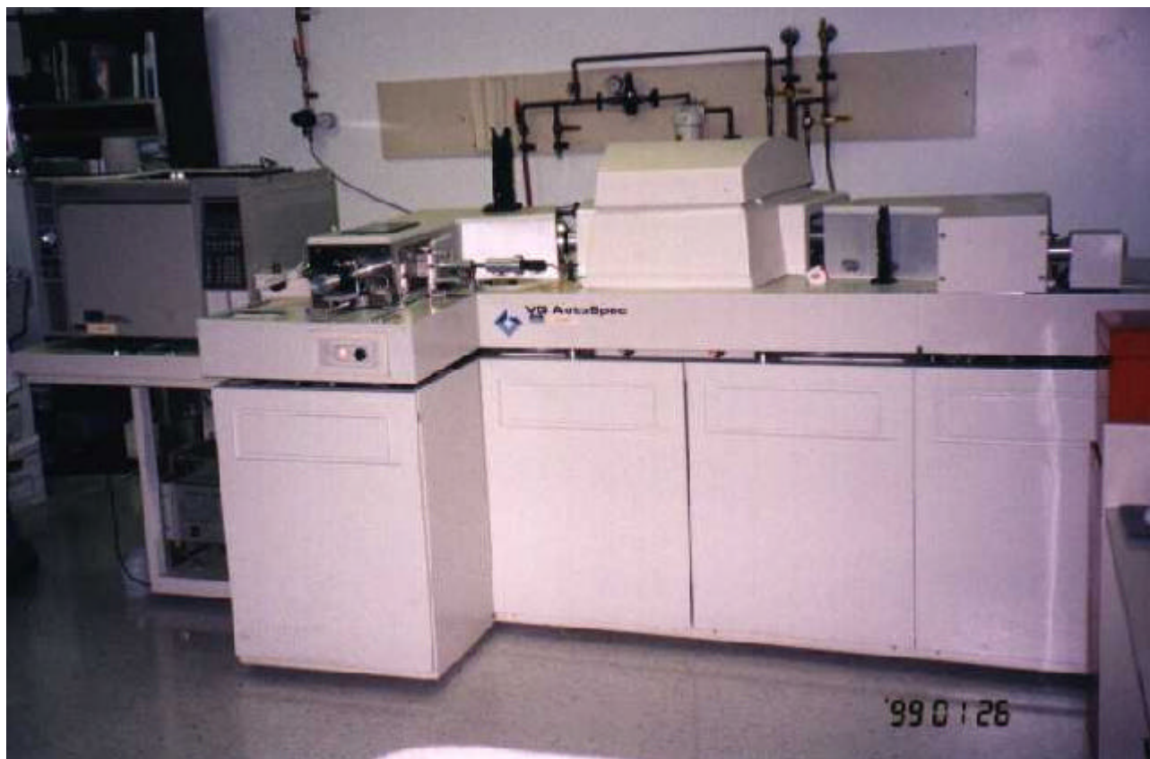
図 2 . (5) - 2 . ガスクロマトグラフ質量分析器